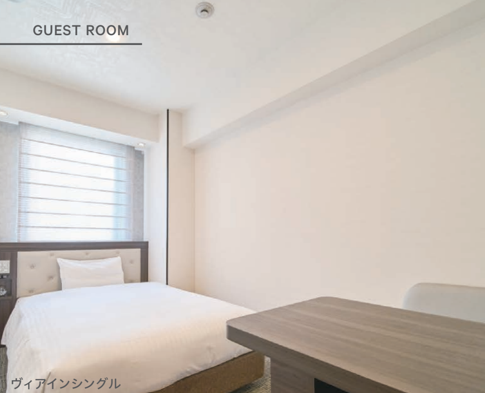
ヴィアインシングル