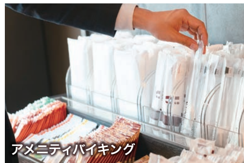
アメニティバイキング