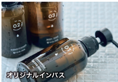
オリジナルインバス