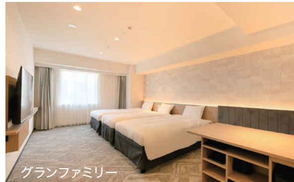
グランファミリー