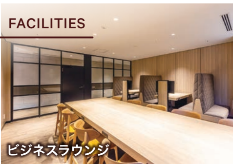
ビジネスラウンジ