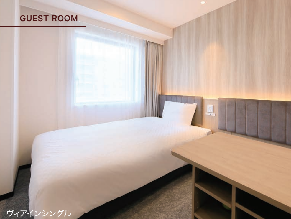
ヴィアインシングル