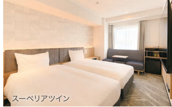
スーペリアツイン