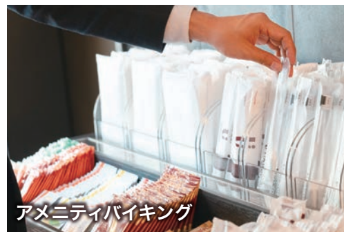
アメニティバイキング