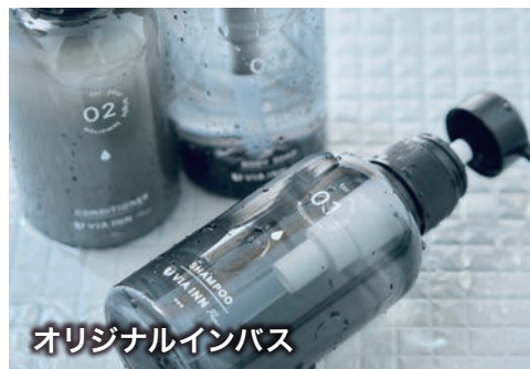
オリジナルインバス