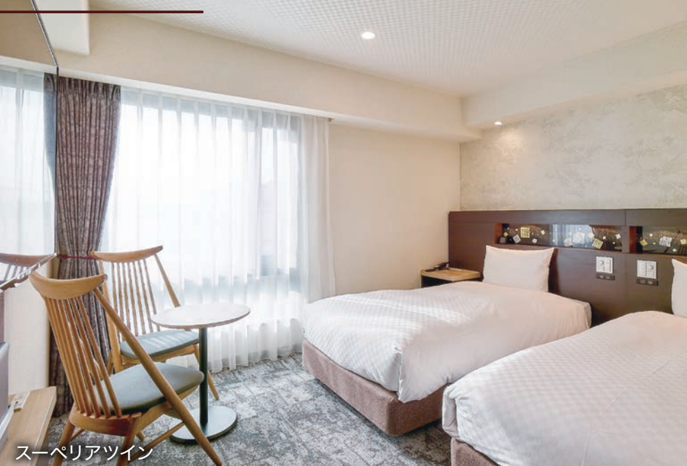
スーペリアツイン