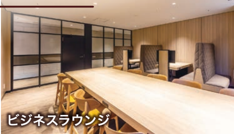
ビジネスラウンジ