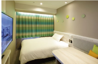
シングルB 140cm幅のベッドと、デスク&チェアを 設置しています。