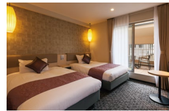
ツインA 50型のテレビやソファのある、広めのお部屋です。テラス付きで京都の雰囲気をお楽しみいただけます。