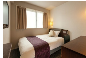
シングルA 140cm幅のゆったりとしたベッドと、ビジネスに便利な大きめのデスクを設置したお部屋です。