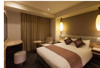
ダブル お一人様でも、お二人様でも快適にお過ごしいただけます。観光におすすめのお部屋です。